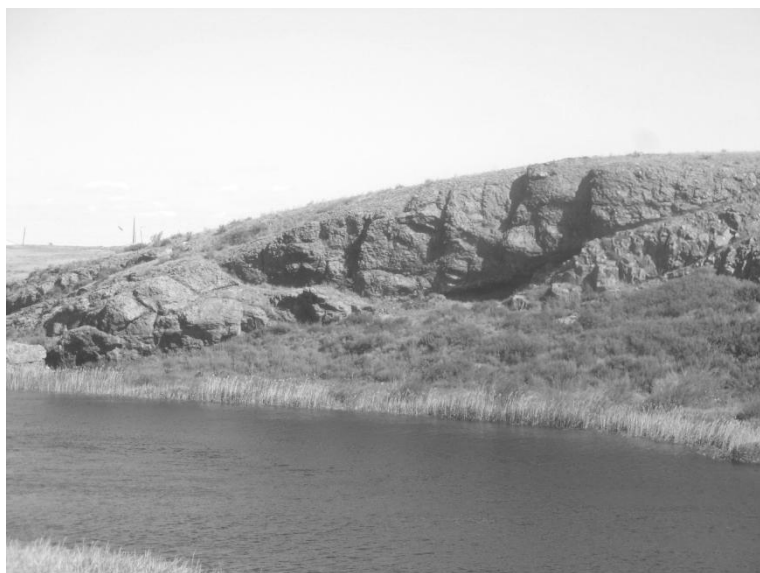
Скала «Кемпир тас»